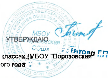
График проведения оценочных процедур в 1-4 классах (МБОУ "Порозовская СОШ) на 2023-2024 учебного года